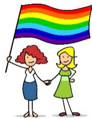
LGBT を表すレインボーカラー

B → バイセクシュアル (両性愛者)、T → トランスジェンダー・性同一性障害 (性的不一致、性別は男性だが、心は女性など) のことを略して LGBT (性的少数派) といいます。